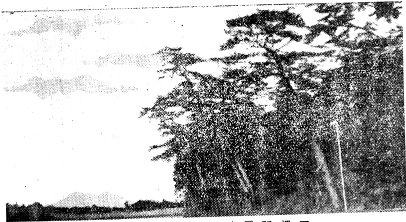
三把稻雷神の森と筑波山