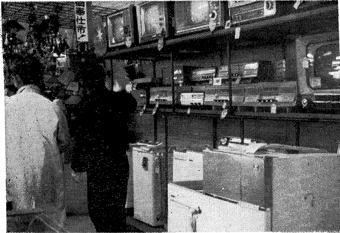
デパートの耐久消費財売場