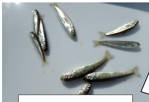
2月21日 那珂川で採集されたサケ

那珂川ではアユ遡上が確認されませんでした。サケの稚魚が採集されました。(3尾/10投網) ※確認後、再放流