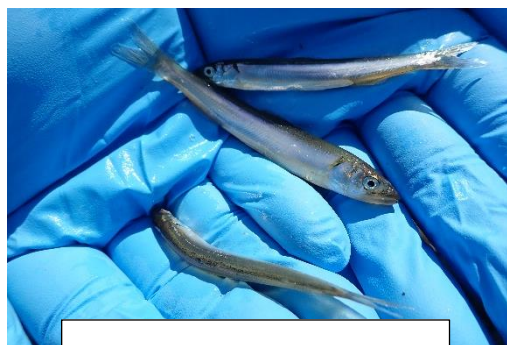
2月21日 久慈川で採集されたアユ