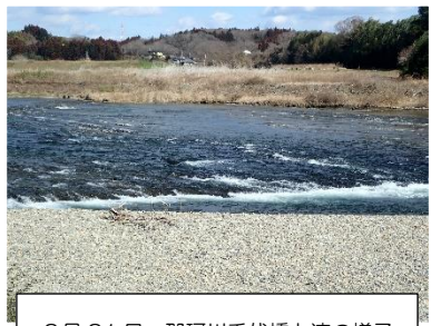
2月21日 那珂川千代橋上流の様子

連絡先 茨城県水産試験場内水面支場 内水面資源部：0299-55-0324 (代)