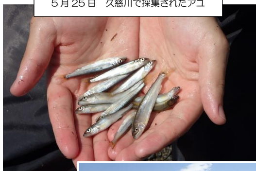
5月25日 久慈川で採集されたアユ