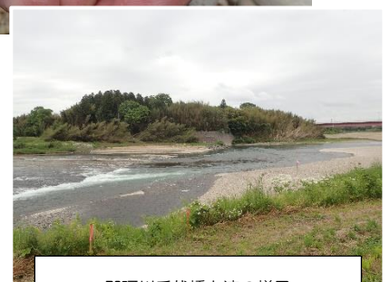
那珂川千代橋上流の様子

連絡先 茨城県水産試験場内水面支場 内水面資源部：0299-55-0324（代）