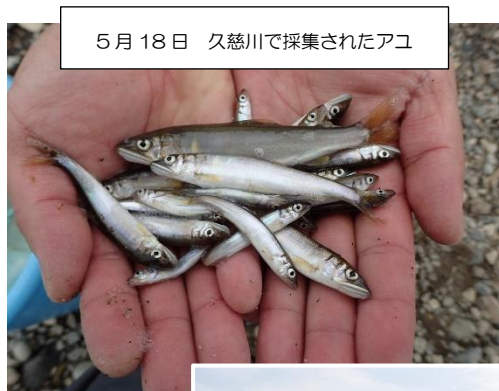
5月18日 久慈川で採集されたアユ