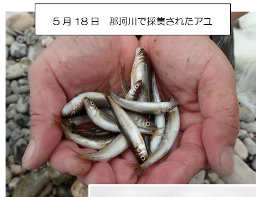
5月18日 那珂川で採集されたアユ