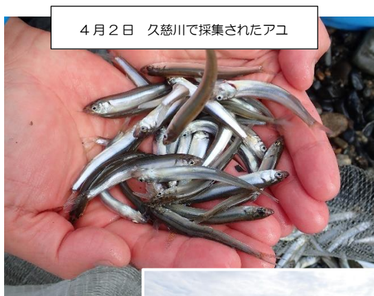
4月2日 久慈川で採集されたアユ