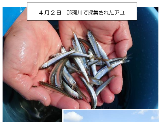
4月2日 那珂川で採集されたアユ