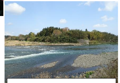
4月2日 那珂川千代橋上流の様子

連絡先 茨城県水産試験場内水面支場 内水面資源部：0299-55-0324(代)