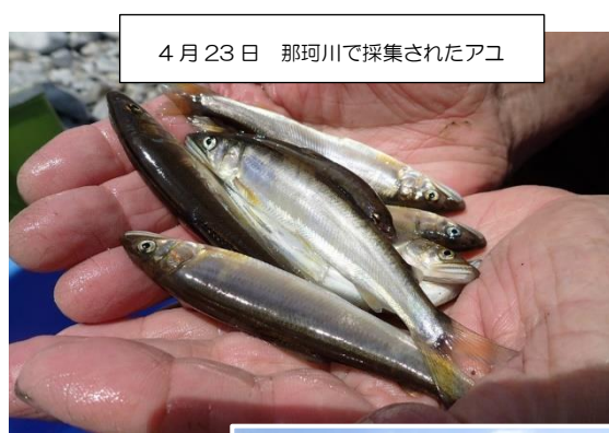
4月23日 那珂川で採集されたアユ