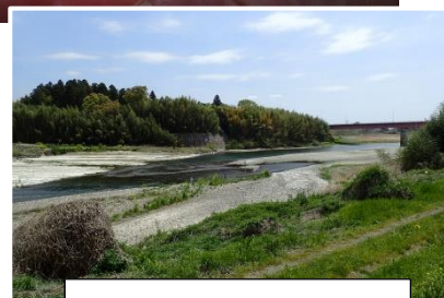
4月23日 那珂川千代橋の様子

連絡先 茨城県水産試験場内水面支場 内水面資源部：0299-55-0324 (代)