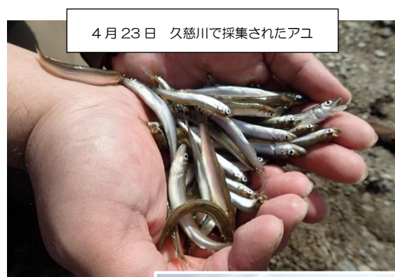
4月23日 久慈川で採集されたアユ