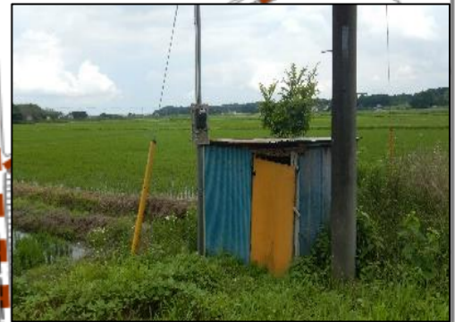
井戸水を利用しているため 水量が不安定なポンプ