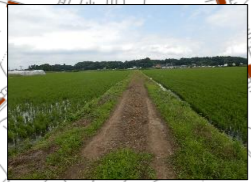
道路が狭小であり、大型農機の 通行に支障をきたしている