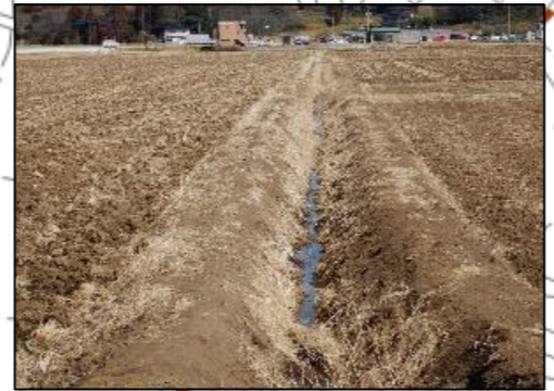
土水路の為、排水性が悪い