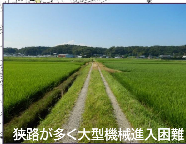
狭路が多く大型機械進入困難