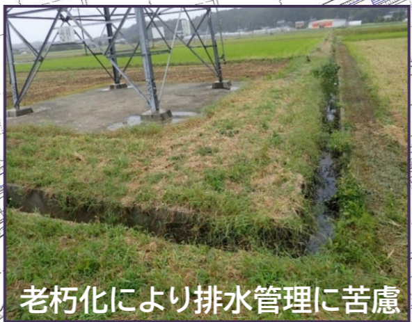
老朽化により排水管理に苦慮