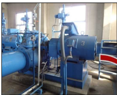
現況 第3号用水ポンプ