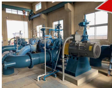
新規 第3号用水ポンプ