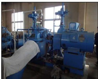
現況 第4号用水ポンプ