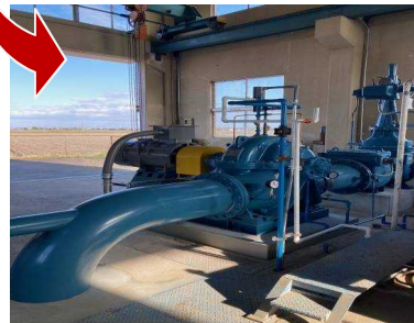
新規 第1号用水ポンプ