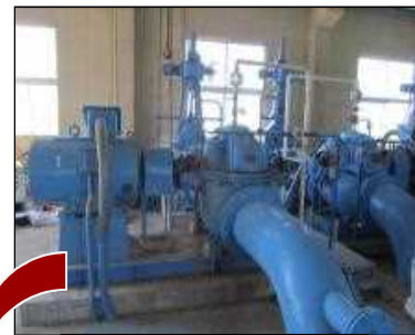
現況 第1号用水ポンプ