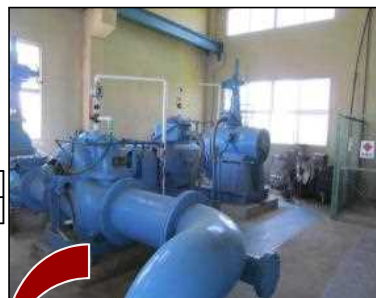
現況 第2号用水ポンプ