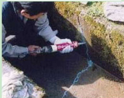
水路のひび割れ補修