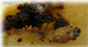
ナシヒメシンクイ幼虫