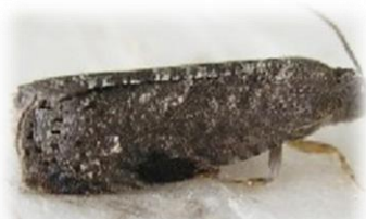
ナシヒメシンクイ成虫