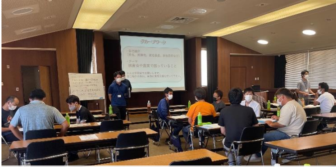
病害虫防除 グループワークの様子

学園生からは「農薬や病気のメカニズムが知れてよかった」「今後の栽培管理に活かすことができる」などの声が聞かれました。