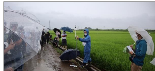
自動給水機の説明

農匠自動給水機と水田farmoについて農業総合センターとメーカーから機器の説明と自動給水の実演を実施しました。実証している生産者からは導入したメリット・デメリットについて「水回りのルートが一つ削減できたので時間に余裕ができた。その反面で雑草の発生に気付くのが遅れてしまったのは反省」とのお話がありました。