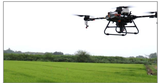
ドローン追肥の様子

56aの圃場にドローンによる追肥を実演しました。約15分のフライトで作業は完了し、オペレーターからは「今回は試験だったので丁寧に散布したが、現場で行うときはシャッター開度を調整することでもう少し効率的に散布が可能」と、今後の水稲栽培におけるドローンの利用拡大について前向きな意見が得られました。