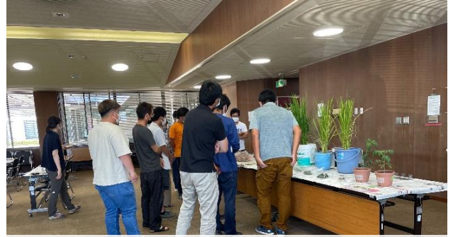
病害虫診断の実習の様子