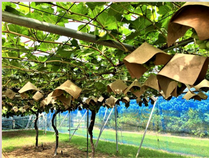
シャインマスカット傘掛けの様子（園芸研究所圃場）