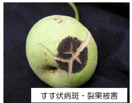
すす状病斑・裂果被害

●したがって、前年の落葉を集めて土中に埋める、あるいは、これからの時期は発病部位を見つけ次第除去し土中深く埋める、といった対策が重要です。