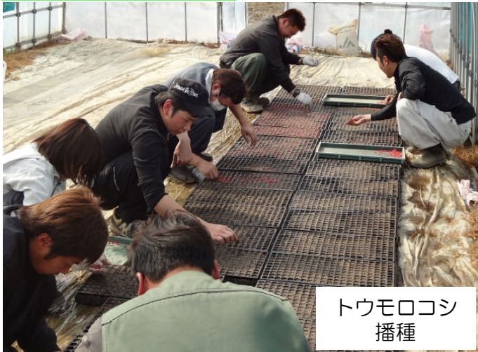
トウモロコシ 播種