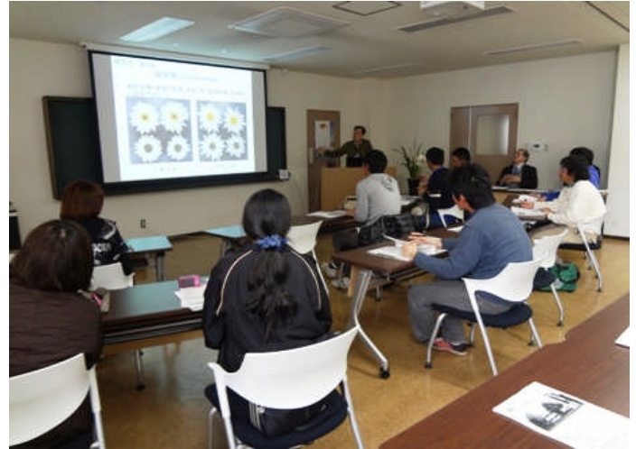
農業学園アグリ講座の様子