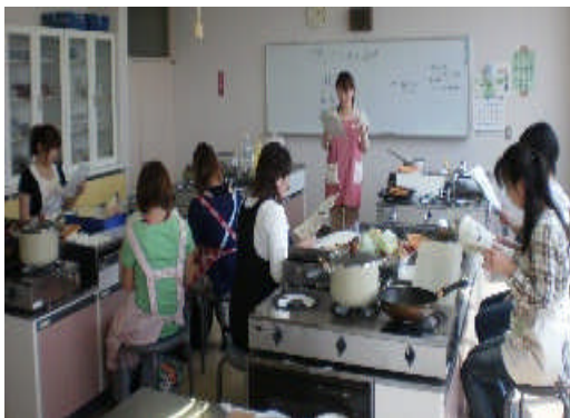
若手女性農業者交流会の様子

普及センターでは、新規就農者や若手女性農業者を対象に栽培技術や交流の場を提供しております。そのため、過去1年の間に就農した方の情報を募集しています。