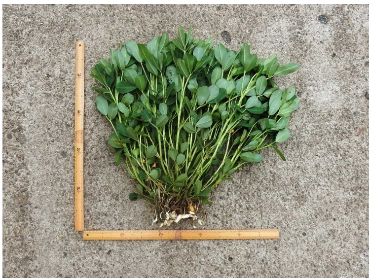
農研所内圃場における ナカテユタカの生育状況 (7月24日撮影) (ものさし:50cm)