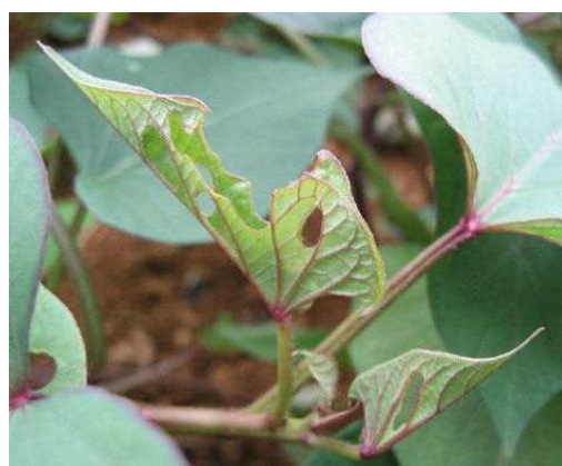
図4 ナカジロシタバによる初期被害