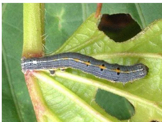
図3 ナカジロシタバ中齢幼虫