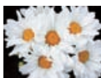
常陸 サマースノウ