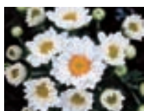
常陸 オータムホワイト

9月彼岸出荷向けの白色品種で、分枝数、花蕾数が多く、ボリューム感に富む頂点咲きの品種です。