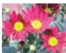
常陸 サニーレビー