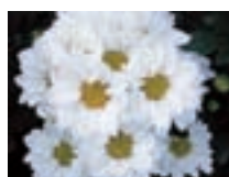
常陸 オータムパール

9月彼岸出荷向けの白色品種で、切花長はやや短く、頂点咲きで締まった良好な草姿の品種です。