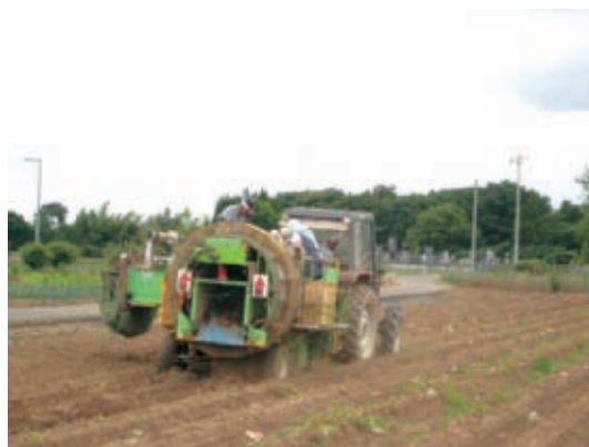
ポテトハーベスターによる収穫作業

今後、コントラクター体制を構築することで、農家の作業負担軽減・適期管理が可能になり、高品質化を図れる産地、契約を遂行できる産地となれるよう体制改善を支援しています。