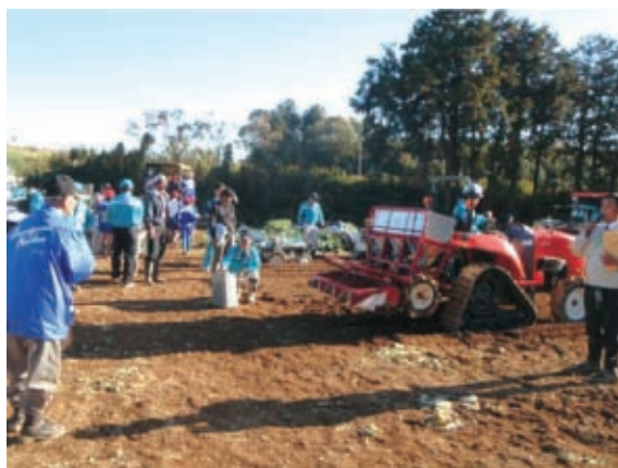
業務用キャベツ生産に向けた機械化体系実演会