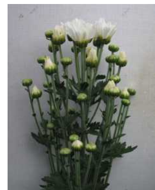
「常陸サマーシルキー」草姿