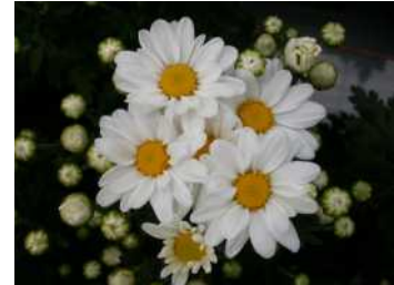
「常陸サマーシルキー」の開花状況