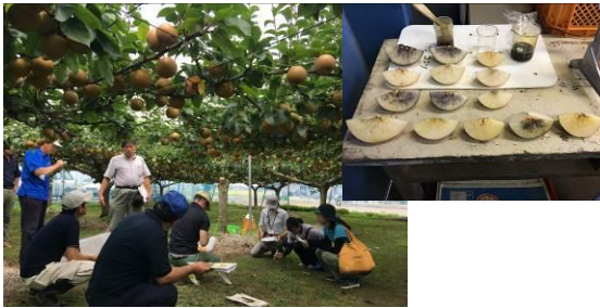
生育状況現地確認・収穫適期検討

主産地の地域農業改良普及センター，農業総合センター（専門技術指導員室，生物工学研究所，園芸研究所）等がチームを組み，技術的課題を中心に各種活動を行っています。