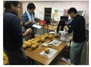
果肉障害発生調査 等