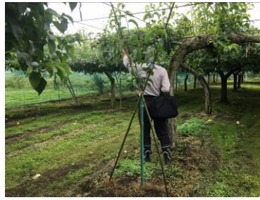
個人出荷者等への巡回指導