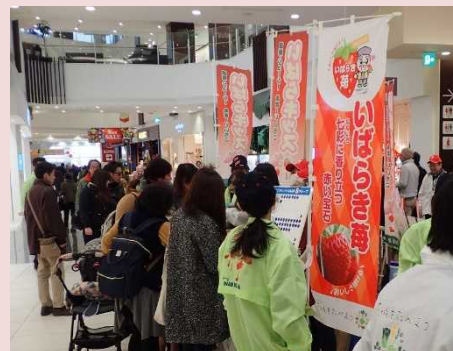
イーアスつくばでのイベント

消費者にいちごづくりの想いを伝え、消費者のニーズを知って、今後の産地づくりに活かしていくために、今回のような消費者とのコミュニケーションは重要と改めて認識できるイベントとなりました。