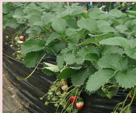
ランナーが発生している様子

ランナーの発生が少しでも見られたら、ハウス内の最高温度が25℃以上にならないように積極的に換気を行い、23～25℃で管理しましょう。（園芸研究所 野菜研究室 山邊）