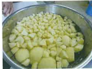
りんごをアスコルビン酸液に漬ける