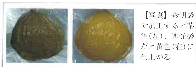
【写真】透明袋で加工すると茶色(左)、遮光袋だと黄色(右)に仕上がる

●糖液は高糖度で大丈夫です。糖度60%の糖液を用いると、甘露煮の糖度は約40%に仕上がります。●包装の際の真空度は98%以上を目安にしてください。加熱すると袋内の空気が膨張して、果肉が動き、割れが発生しやすくなります。●包装袋は加熱と冷凍に耐性のあるものを選んでください。また、遮光性のある袋を用いるとクリ「ぼろたん」でもきれいな黄色に仕上がります（写真）。●選別・詰め替えが必要な場合は、加熱2回後に行くと、途中開封による風味の低下が少なくなります。●クリ「ぼろたん」を加工する時は、下になった果肉が割れやすいので、袋を立てたり積み重ねたりしないよう注意してください。