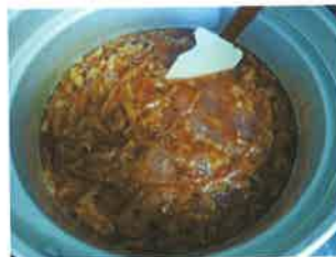
りんごの皮を煮る