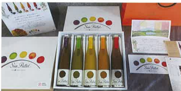
最優秀賞を受賞した有限会社大地の 「大地のミニトマトジュースSun pallet」

審査員からは、「県内の農産物の特長を上手く活かした加工品が揃っていた。1次加工で原料を確保し、周年加工に取り組んで欲しい。正確で適正な食品表示はさらに留意して欲しい。」等の講評がありました。今後、加工品製造・販売活動等に頂いた講評を活かしたレベルアップが期待されます。(入賞品一覧は裏表紙参照)