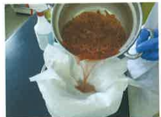
漉して色素液をとる