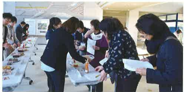
一般参加者による求評会

今回は例年以上に商品性の高い加工品が多く出品され、将来性に期待を込めて奨励賞3点が追加されました。