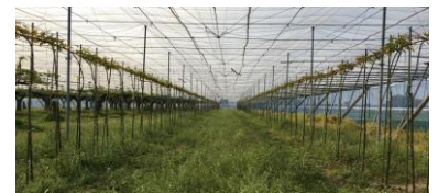
写真 ジョイント栽培導入(1年目)の様子 (R1/12月定植→R2/3月接木→樹形完成)

園芸研究所では、「恵水」のジョイント仕立て栽培が早期多収に有効であることを確認しました（ジョイント実施後 3 年目に収量約 6t/10a）。新植やまとまった面積の改植の際に導入をご検討ください。なお、当技術は神奈川県の特許技術で、実施料の支払いが必要となりますのでご注意ください。