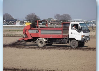
流域外の農地への堆肥散布