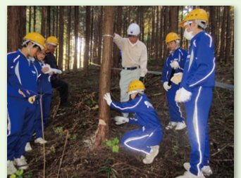
森林・林業体験学習