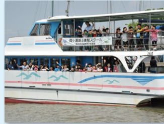
霞ヶ浦湖上体験スクール