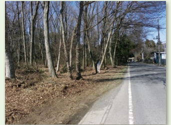
整備された平地林