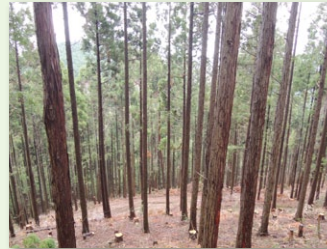
間伐が実施されたスギ林