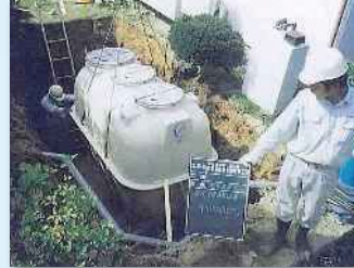
高度処理型浄化槽の設置