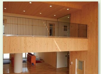
公共施設の木質化