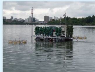
アオコ抑制装置の設置