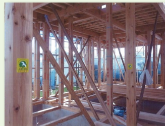
県産木材を使った住宅の建築