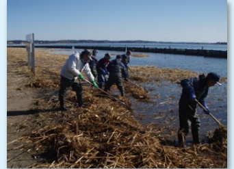
ヨシ帯の保全活動