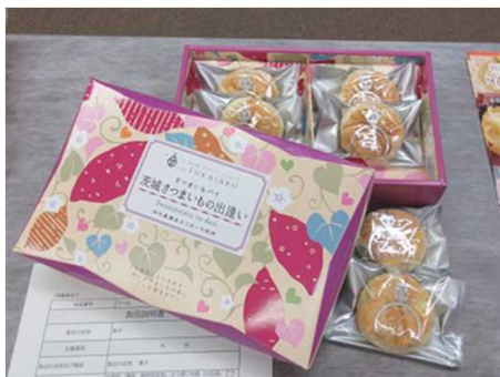
茨城さつまいもの出逢い