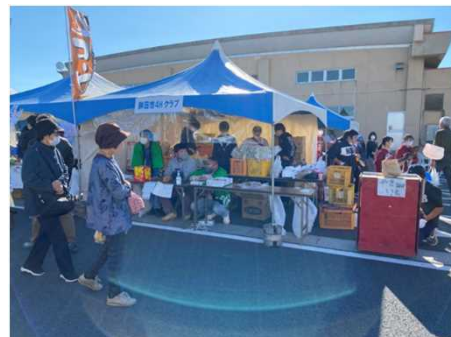
水戸市商工祭の様子

今後も、若手農業者の仲間づくりや農業経営の学びの場となり、地域に根差した活動を目指す銚田市4Hクラブの活躍が期待されます。