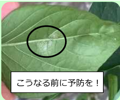
こうなる前に予防を!

うどんこ病は感染すると防除が困難となるため、予防的な防除が重要です。抑制栽培では9月上旬から発病し始めますが、8月上中旬には菌に感染しており、一ヶ月程度潜伏期間があります(図)。そのため8月上中旬からの防除が効果的です。効果的な薬剤(茨城県農業総合センター園芸研究所のHPを参照)を2~3週間間隔で散布します。予防効果のみを持つ硫黄剤を使用する場合は、定植10日後から処理を始めましょう。