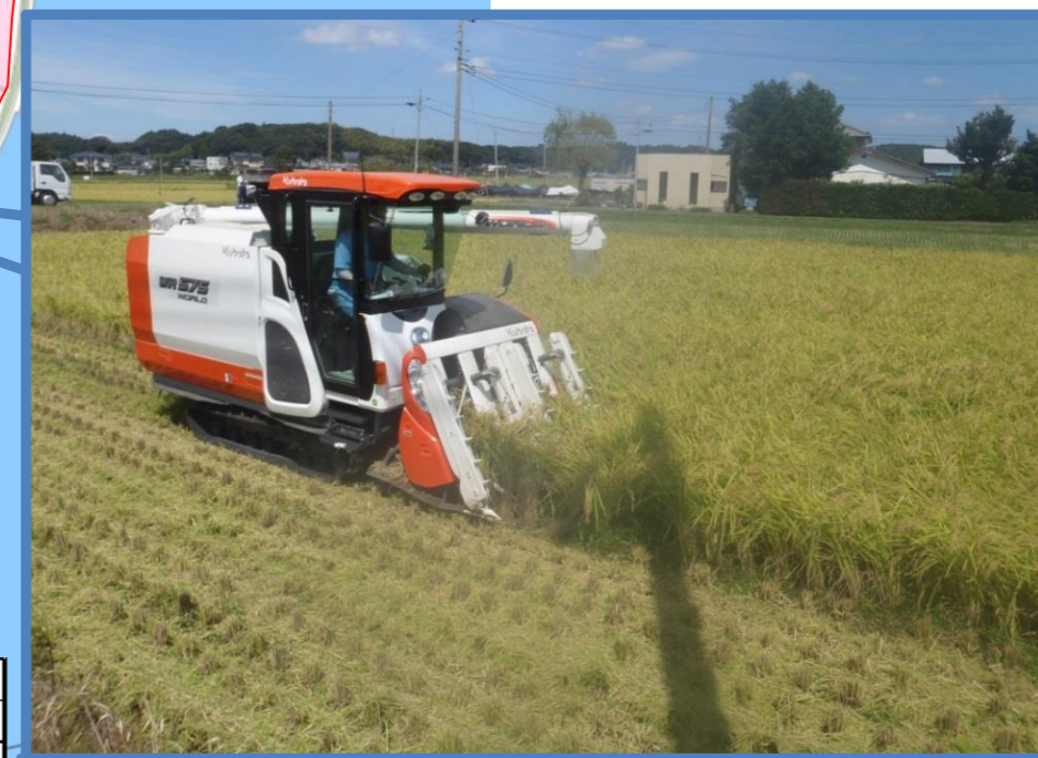
平坦地区域:北浦湖岸の平坦地での稲作風景