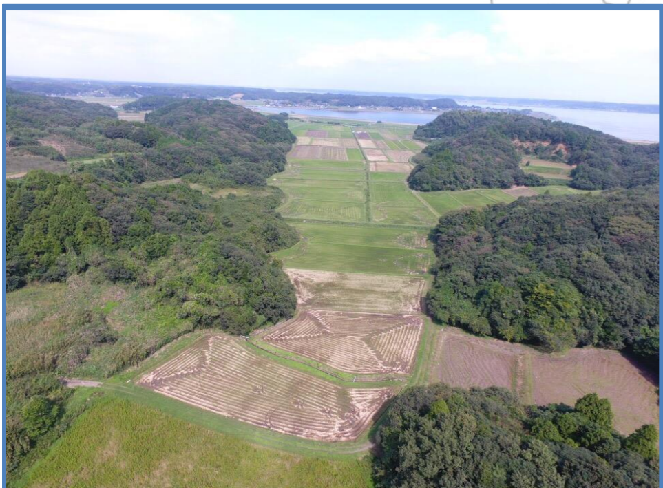
谷津区域:台地に入り込んだ地形に水田が広がる