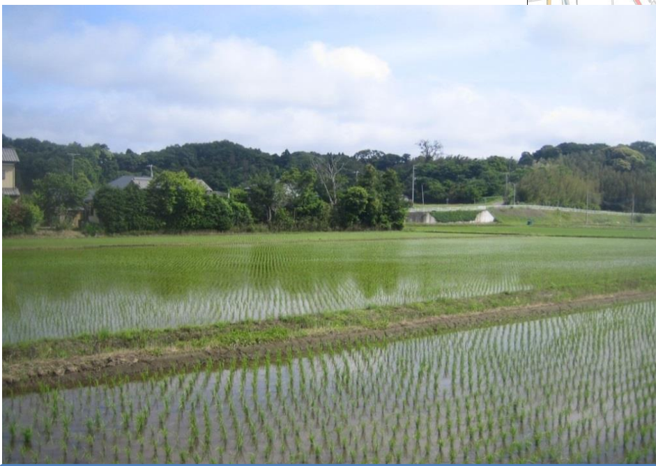
潮来市牛堀地区の営農状況