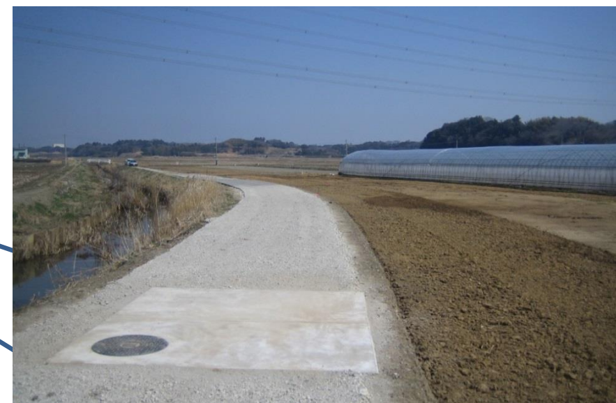
支線道路沿いに埋設された送水管