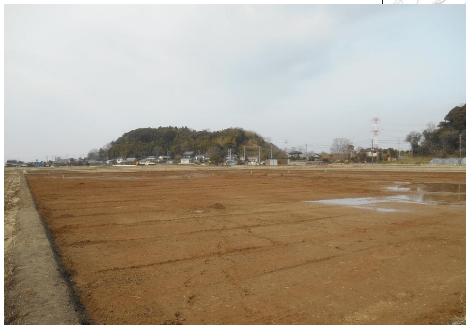
客土が実施された水田