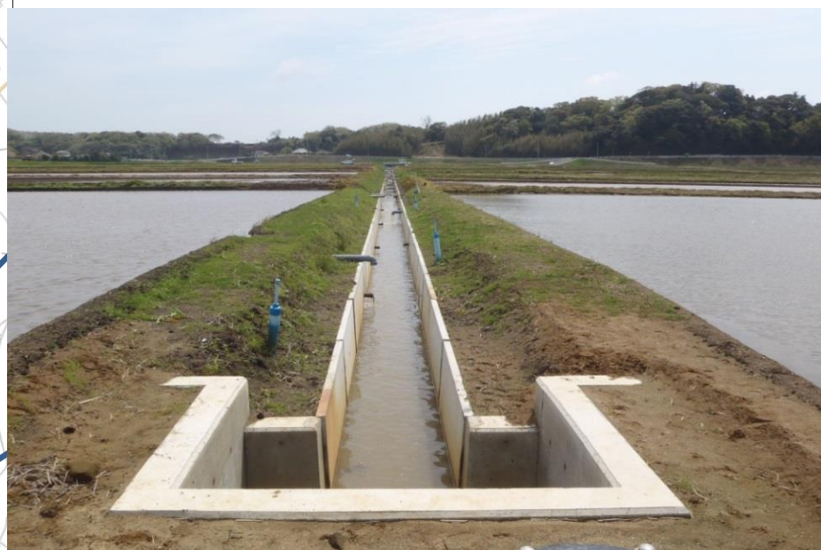
事業により改修された排水路