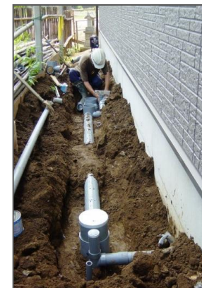
排水設備設置状況