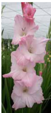
図1 「常陸はなよめ」の花容