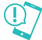
接触確認アプリ の活用

聖火リレーを沿道等で観覧される際には、上記の新型コロナウイルス感染症対策にご留意いただき、特に密を避け、広がっての観覧にご理解とご協力をお願いします。また、聖火リレーの様子はNHK聖火リレー専用サイトで中継されますのでぜひご覧ください。NHK聖火リレー専用サイト▶ https://sports.nhk.or.jp/olympic/torch/