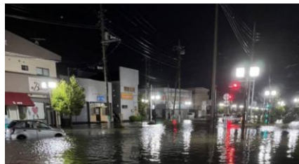
令和5年台風第13号による 県内の浸水被害の様子