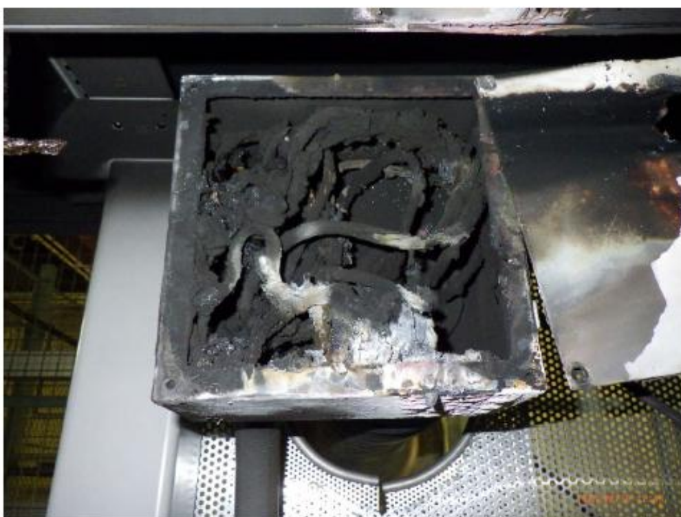
火災が起きたケーブル収納ボックス