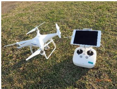
▲県が配備しているドローン DJI Phantom4

ドローンによる画像処理技術は、① 広大な現場であっても全体像を把握することができる とともに、② 面積や体積の簡易測定が迅速にできる ことから、既に事案の実態把握に活用しています。