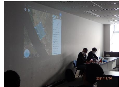
▲クラウド型ドローン測量サービス「くみき」 操作実習の様子