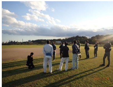
▲ドローン飛行実習の様子