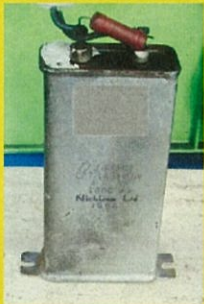
エレベーター内から