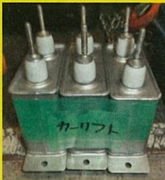
カーリフト内から

昇降機の設備内に、 高濃度PCBを使用した コンデンサーが 設置・保管されていた場合