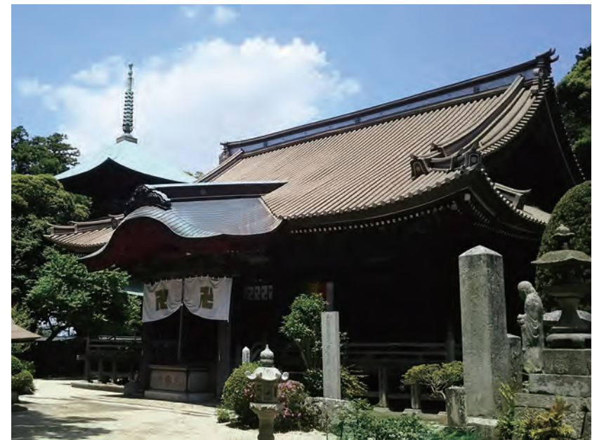
椎尾山薬王院 (奥は三重塔)