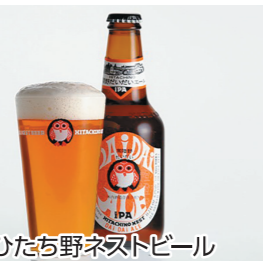
ひたち野ネストビール