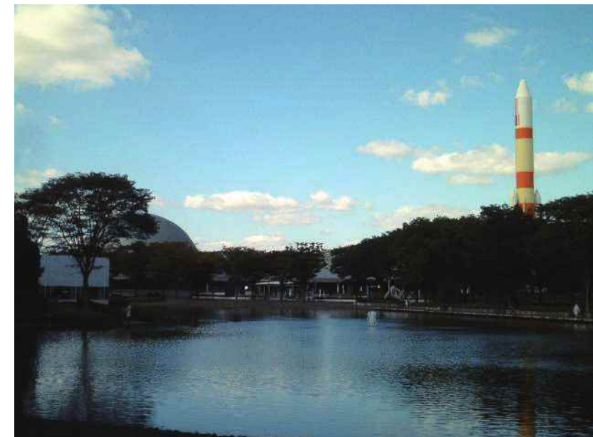
つくばエキスポセンター