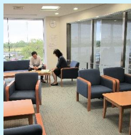
休憩可能なフリースペース