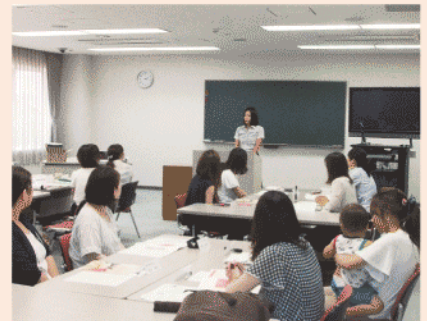
復職研修会の様子

平成28年度の利用率はほぼ100%の見込みで、男性も当たり前育児休職を取得するという風土づくりにつながっています。