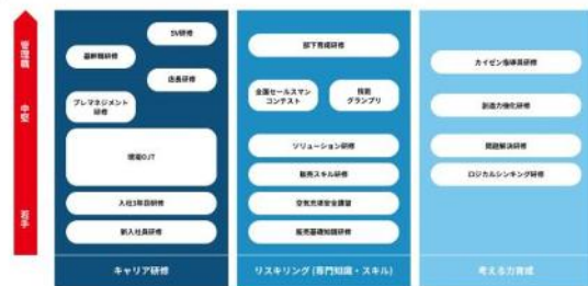
キャリアに応じた豊富な研修制度