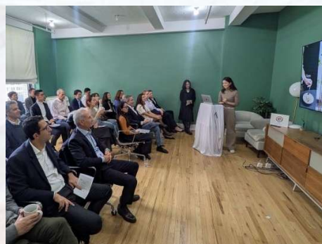
ピッチセッション