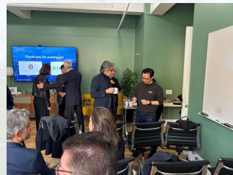
ネットワーキング