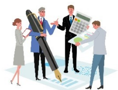
ビジネスプラン 構築研修