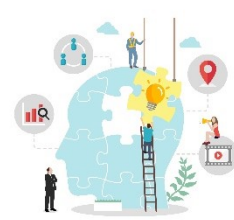
AI・ビジネスモデル研究会 IoT・ロボット活用分科会

本事業で新しいビジネスに挑戦した多くの企業事例を 3年分まとめてご覧いただける絶好の機会です!!