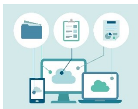
AI・IoT人材育成 (研修・セミナー)