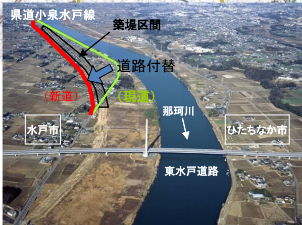
那珂川大野築堤箇所