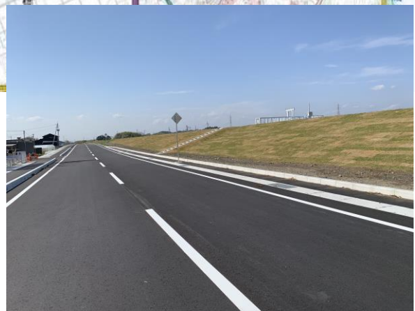
県道小泉水戸線バイパス完成箇所