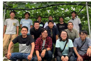
<茨城県ぶどう連合会青年部員の方々>

全国的に注目を集めている「シャインマスカット」ですが、茨城県でも品種登録当初から栽培されており、県内各地のブドウ園で販売されています。9月27日（火）、茨城県ぶどう連合会青年部主催で「シャインマスカット」の果実品評会（出品数は約35点を予定）が開催されます。イバラキセンスでは、品評会の結果を受け、9月28日（水）から 受賞房3房と、上位房10房程度を展示・販売 する予定です！選りすぐりの「シャインマスカット」を購入できる貴重なチャンスをお見逃しなく！