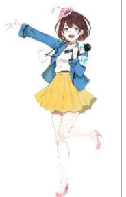
茨城県公認Vtuber 茨ひより