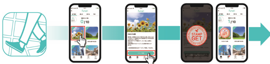
①デジタルスタンプラリーアプリ 「furari」