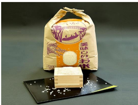
潮来市産コシヒカリ

お米や和菓子等の潮来市特産品や、潮来市のゆるキャラ「あやめ・よしきり」グッズ、りんりんロードのノベルティなど豊富な景品をご用意しておりますので、ぜひお立ち寄りください。