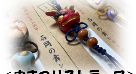
<おまつりストラップ>