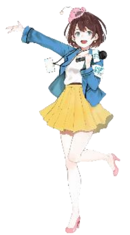
茨城県公認Vtuber 茨ひより