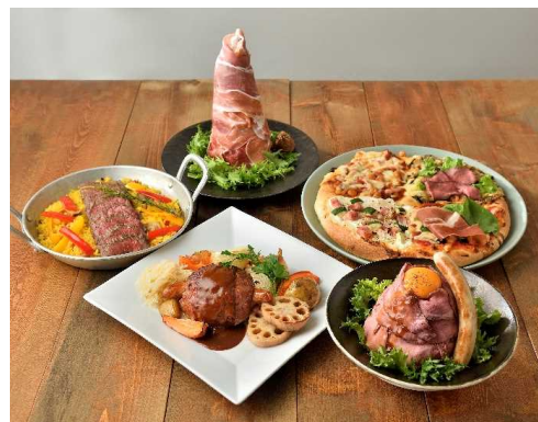
IBARAKI肉肉フェア 特別メニュー ※写真はイメージです。