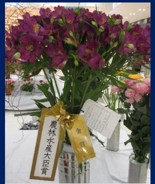
第44回農林水産大臣賞受賞 アルストロメリア「アメジスト」

主 催：茨城県、茨城県花き園芸協会、公益社団法人茨城県農林振興公社、 全国農業協同組合連合会茨城県本部