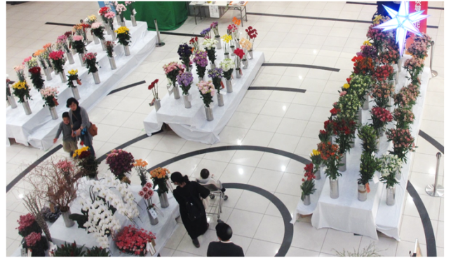
第44回展覧会の様子

つきましては、関連情報告知のご協力とともに取材をご検討いただきたく、ご案内申し上げます。